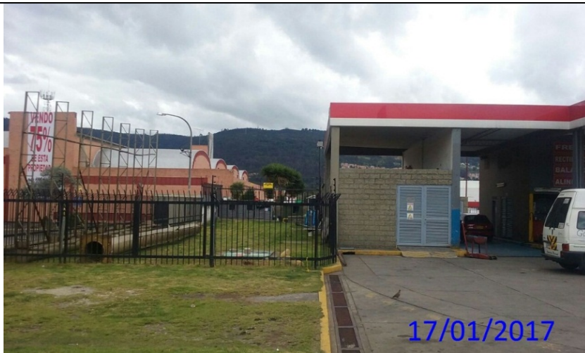
FOTOGRAFIA 2: Foto del predio ubicado en la Avenida Carrera 45 No. 192 - 30, en el cual no se encuentra instalado ningún elemento de publicidad exterior visual tipo valla tubular.